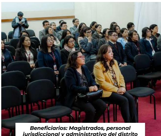
Beneficiarios: Magistrados, personal jurisdiccional y administrativo del distrito judicial de Áncash.