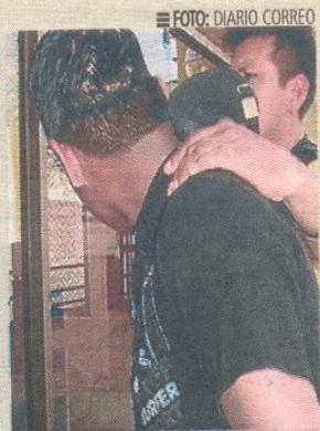
Personas al margen de la ley