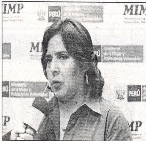
Ministra Ana Jara se pronunció por la captura del presunto violador de Los Aquijes

Asimismo, exhortó al Fiscal Alioska Antezano que asumió el caso en la Fisca-