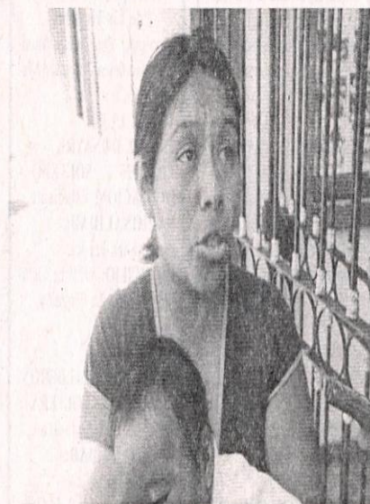
● Esposa del sereno detenido denunció que estaba siendo extorsionada por falsos policías