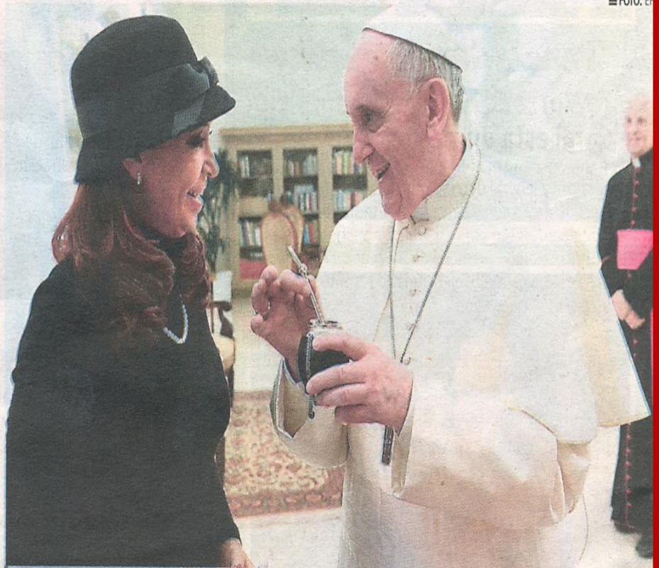
ENCUENTRO. Pontífice recibió numerosos regalos de parte de mandataria gaucha

"Es imprescindible para que todos los países cumplan las resoluciones de las Naciones Unidas y nuestra instancia al Papa va