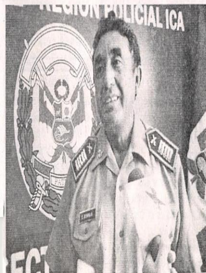
● El Comandante Ochoa armó un plan para atrapar a los policías farsantes