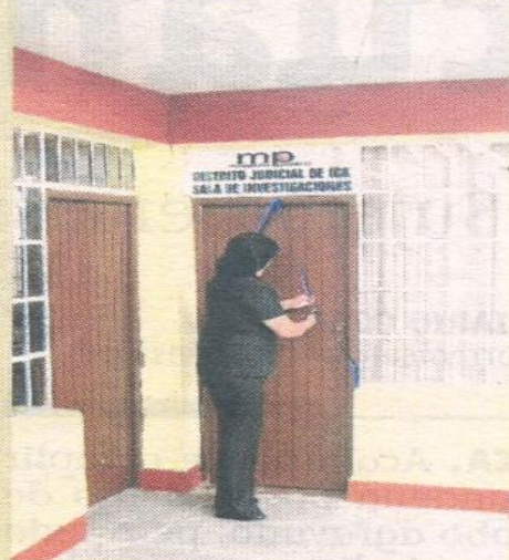
Sala de investigaciones