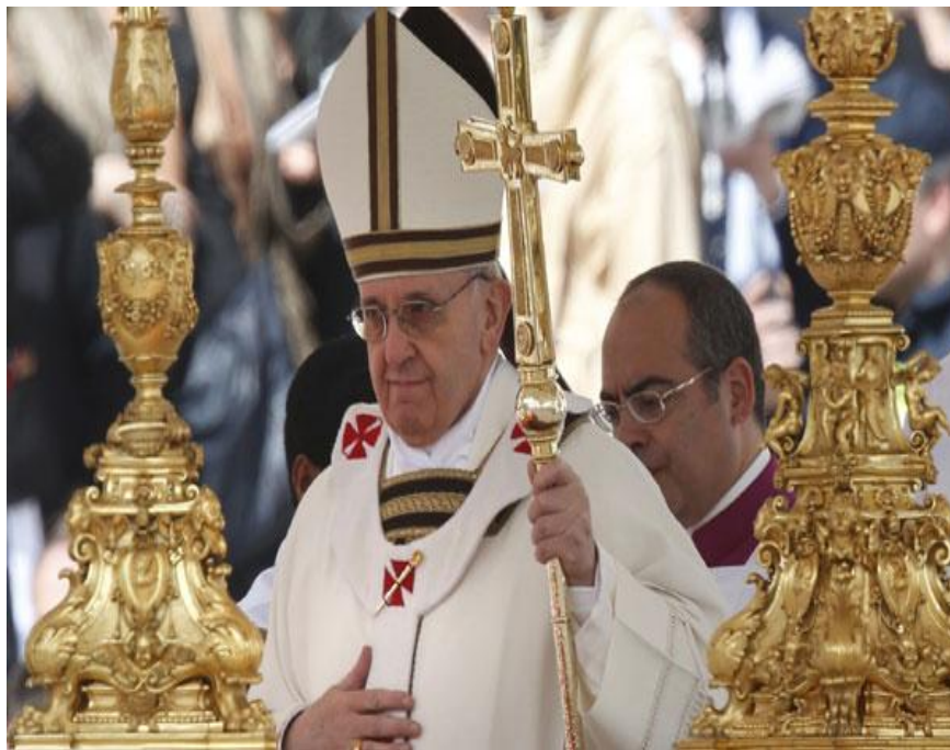
El papa Francisco con los símbolos papales.

El Sumo Pontífice recibió los símbolos papales y luego, en una misa ante unos 150 dignatarios, les pidió ser “custodios” de la creación de Dios