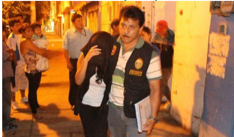
Primas permanecieron secuestradas durante 24 horas.

Falsos locutores, con engaños, las citaron en departamento donde las secuestraron y ultrajaron.