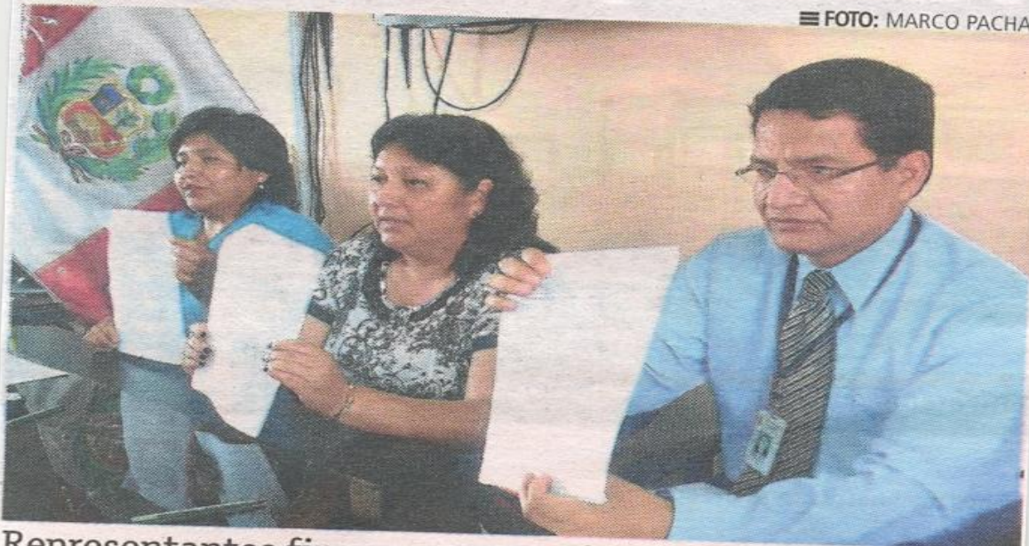
Representantes firmaron convenio en Chincha