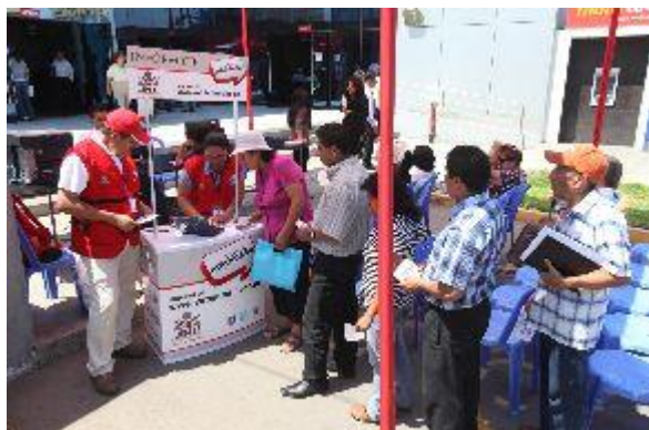
Voto informado realiza campaña de educación electoral en el marco de la revocatoria.

Lima, feb. 18 (ANDINA). El Programa Voto Informado del Jurado Nacional de Elecciones (JNE) recorrió las calles de Lima Metropolitana con el propósito de promover el voto responsable entre la ciudadanía.