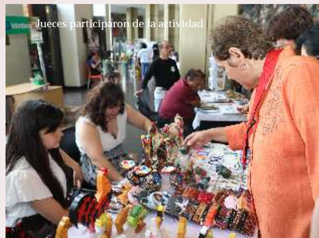
Jueces participaron de la actividad