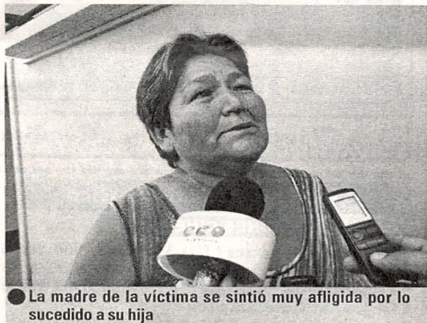
● La madre de la víctima se sintió muy afligida por lo sucedido a su hija