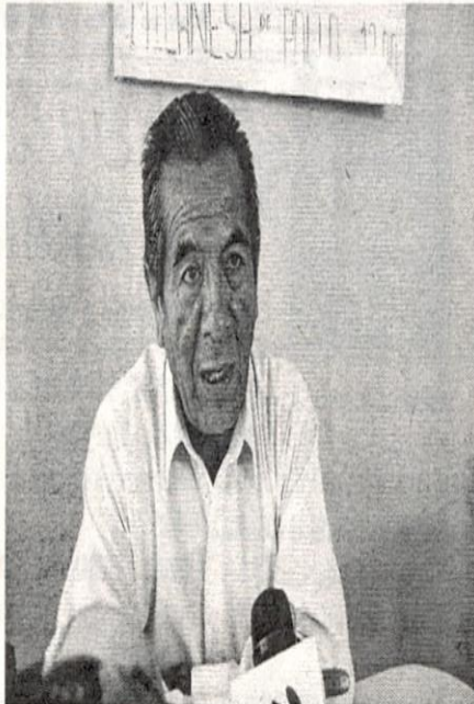
● Abogado de alumna agraviada pide apoyo a la Ministra de La Mujer, Ana Jara