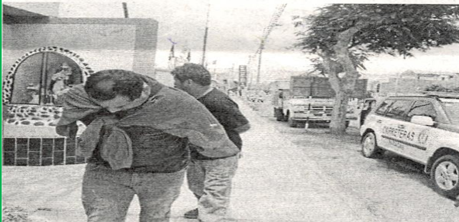
● Policía indignada por liberación de sujetos intervenidos, quienes fallaron en su intento de robo

Señala que es falso que haya sido sorprendido por la Policía en Ocucaje "marcando" vehículos interprovinciales, cuando ahora trabaja con su padre que es chofer de un ómnibus que traslada pasajeros de un fundo agroindustrial. (DBD)