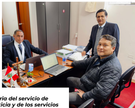
La población usuaria del servicio de administración de justicia y de los servicios administrativos de la CSJAN.