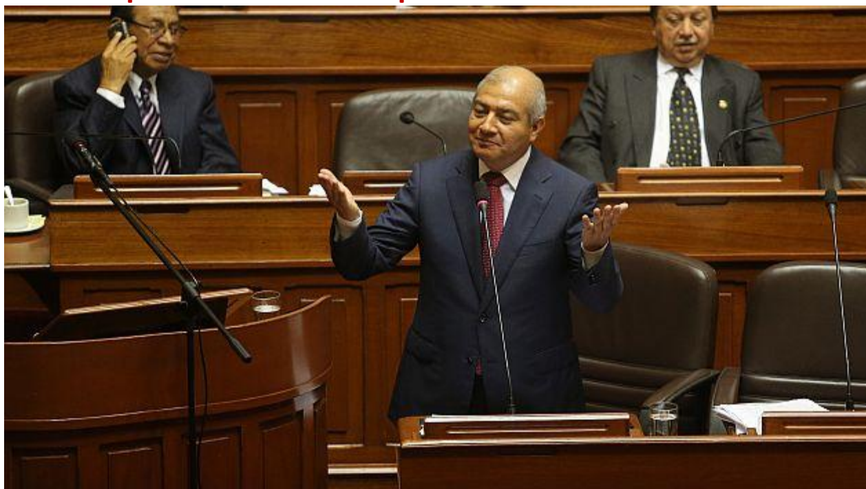
Pedraza podría estar pasando sus últimos días en el despacho de Córpac.

El ministro del Interior no convenció en el Congreso. La oposición presentó la moción para votar su destitución.