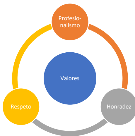
Los valores institucionales del Poder Judicial