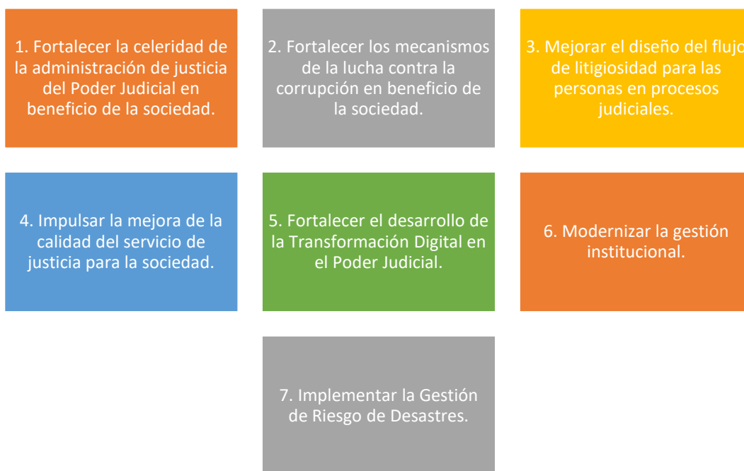
Los Objetivos Estratégicos del Poder Judicial