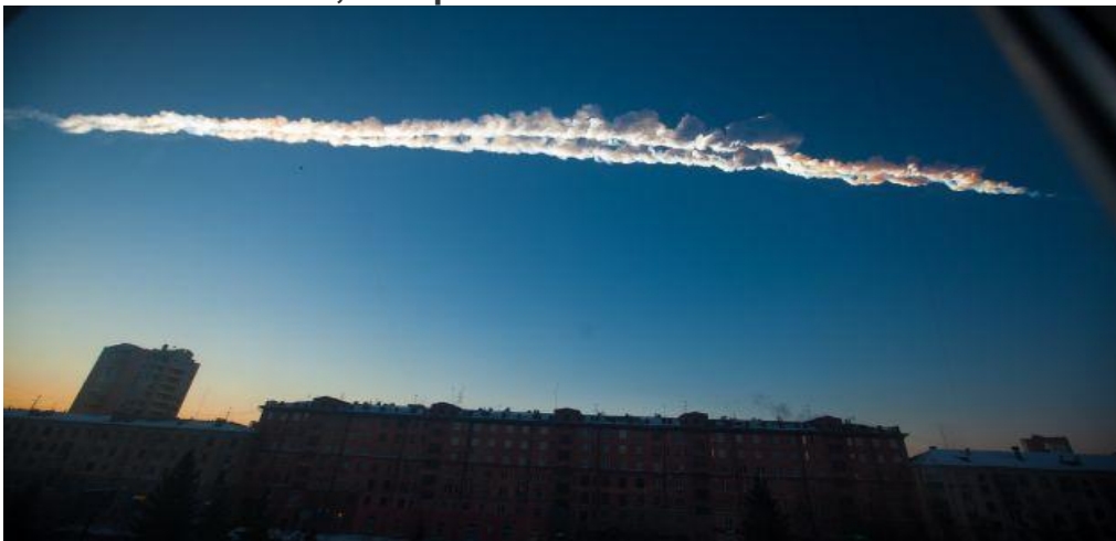
El meteorito dejó una enorme estela de nubes en los Urales.

Las ondas de choque del fenómeno causaron numerosos daños y pánico en los Montes Urales. El cuerpo celeste, de unas 10 toneladas de peso, ingresó a la Tierra a una velocidad de 54,000 kph.