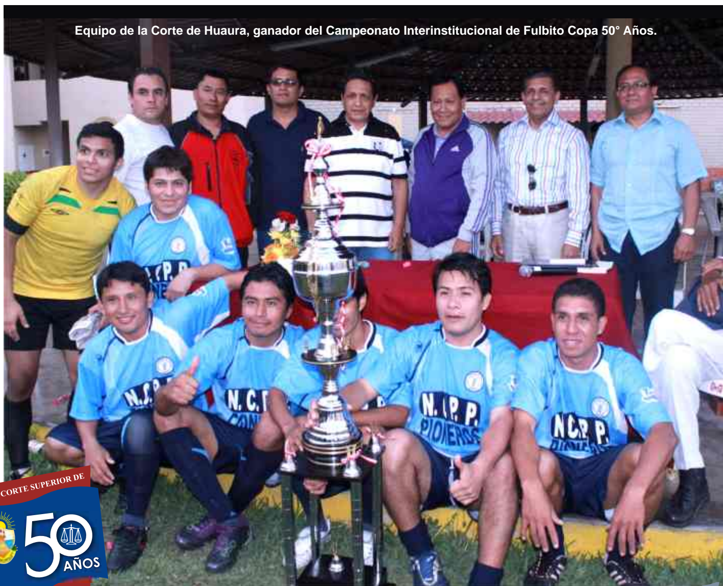
Equipo de la Corte de Huaura, ganador del Campeonato Interinstitucional de Fulbito Copa 50° Años.

La delegación de la Corte Superior de Justicia de Huaura y la Gerencia General de la Corte Suprema fueron los finalistas de este torneo que se desarrolló entre las diez de la mañana y las seis de la tarde, el mismo que otorgó un trofeo a los integrantes del equipo de la Corte Superior de Huaura por obtener el primer lugar y como subcampeón a la Gerencia General del Poder Judicial.