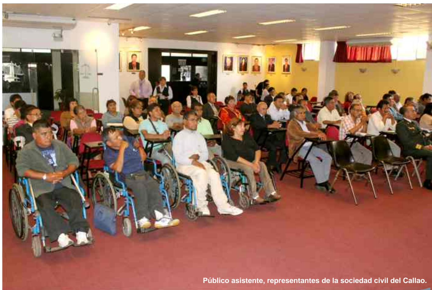
Público asistente, representantes de la sociedad civil del Callao.

“Los integrantes del Poder Judicial, y sobre todo esta ODECMA necesitamos la participación de la sociedad civil; por eso es que los hemos invitado para solicitarles su participación en la acción de lucha contra la corrupción, necesitamos su compromiso en la función contralora para poder desarrollar acciones preventivas con la finalidad de erradicar la corrupción” acotó la Jefa de ODECMA, instándoles a involucrarse en las tareas de administración de justicia, ya que la sociedad civil constituye un aliado importante en la lucha contra la corrupción.