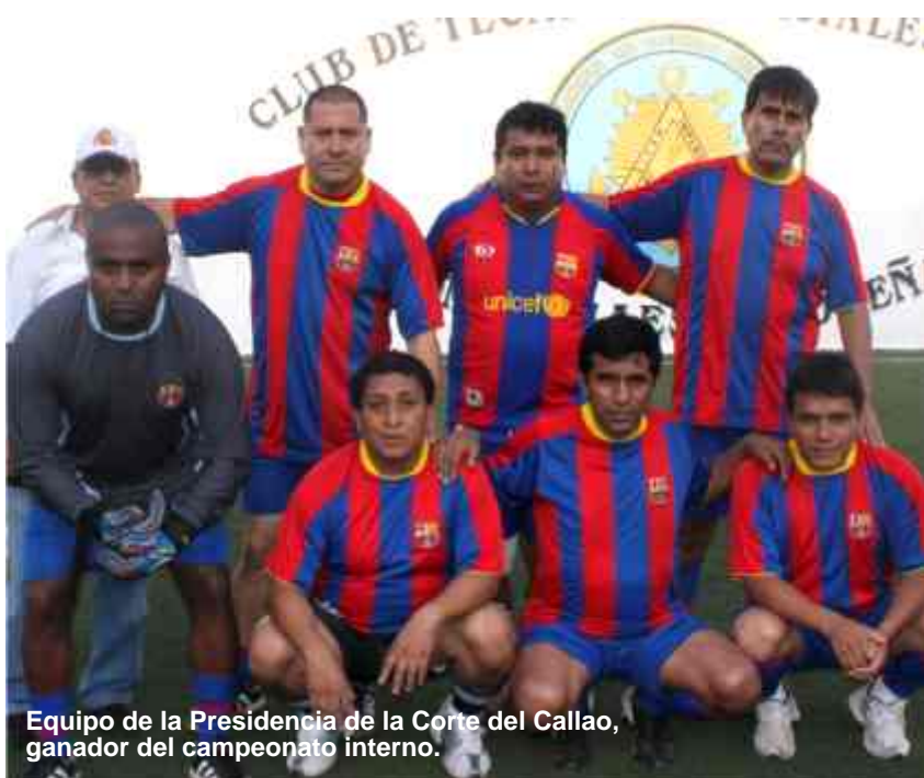
Equipo de la Presidencia de la Corte del Callao, ganador del campeonato interno.