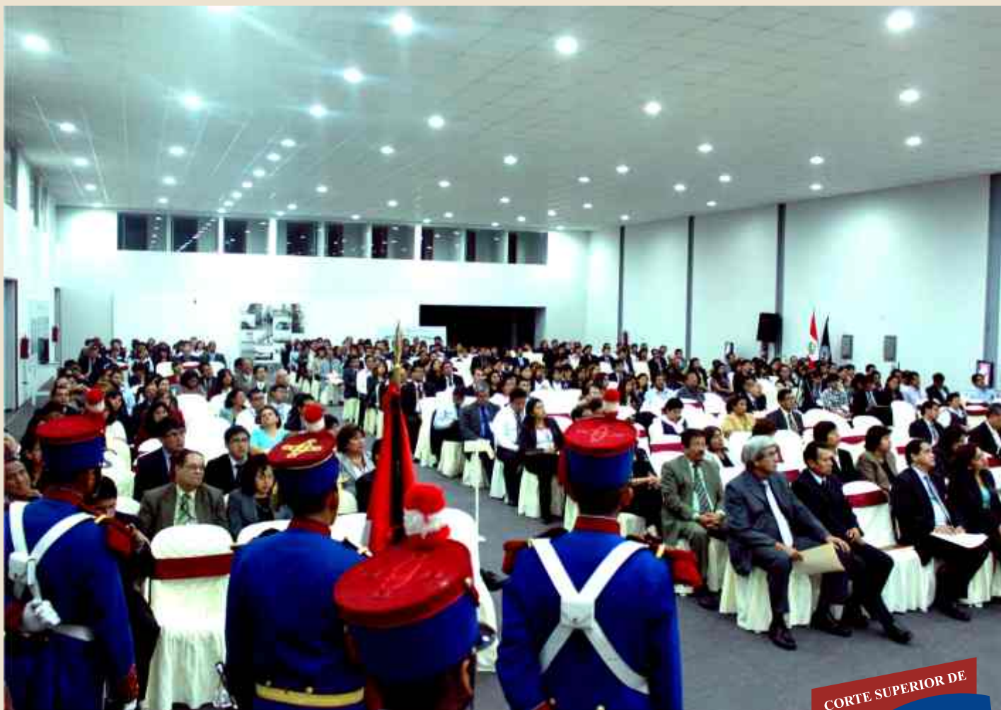
La asistencia fue masiva en las dos fechas en que se desarrolló el Congreso Internacional.