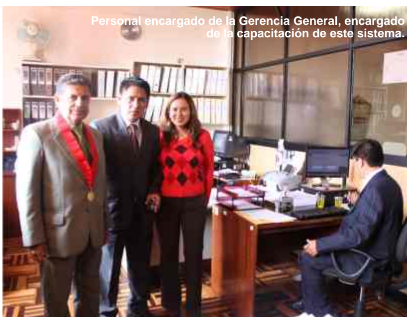
Personal encargado de la Gerencia General, encargado de la capacitación de este sistema.