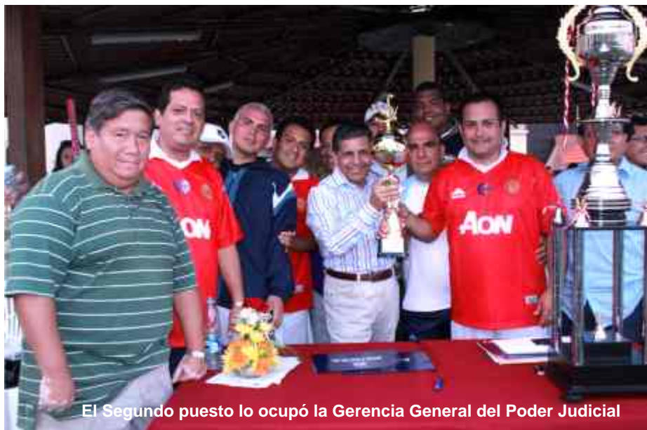
El Segundo puesto lo ocupó la Gerencia General del Poder Judicial

También participaron los equipos de las Cortes Superiores de Lima Norte y Huaura, así como del Tribunal Constitucional, de la Asociación Nacional de Magistrados, el Colegio de Abogados del Callao, la XX Dirección Territorial Policial del Callao y la Legión Peruana de la Guardia, quienes demostraron gran entusiasmo y mucha habilidad en el manejo del balompié.