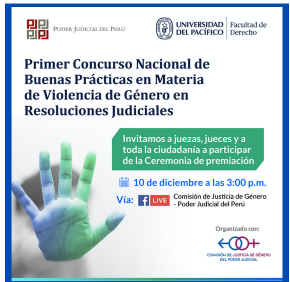
Afiche de convocatoria a la premiación.