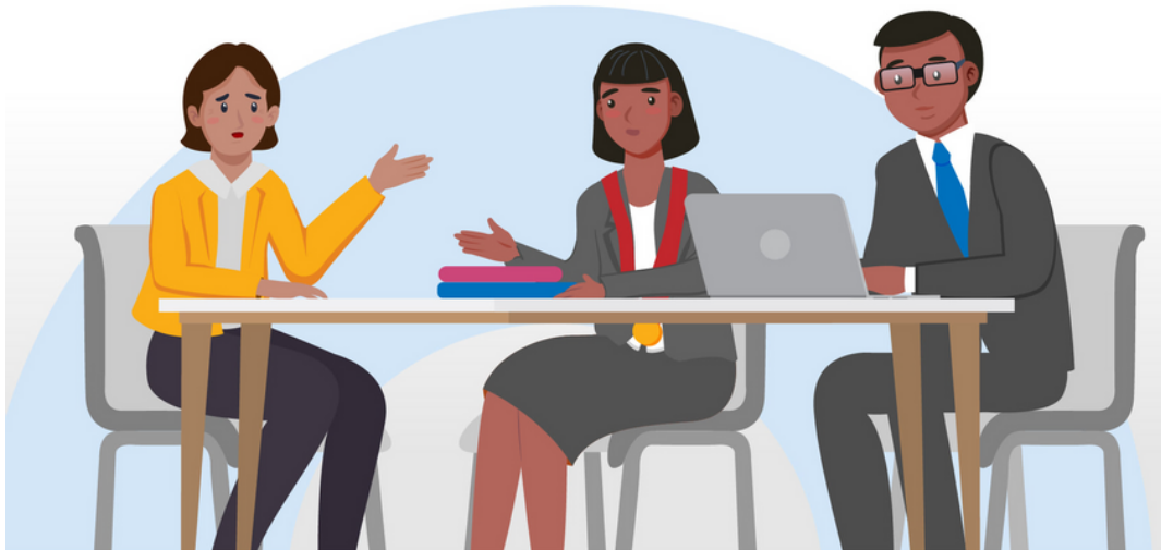
Figura tomada de la Cartilla #JusticiaconIgualdad "Hacia una justicia libre de estereotipos de género"

Asimismo, en IGUALDAD DE GÉNERO , se organizaron dos cursos cortos sobre lenguaje inclusivo con el apoyo del MIMP, dirigido a personal de la Corte Suprema (mayo) y un curso corto sobre Género y Derecho con la Sub Gerencia de Capacitación del Poder Judicial (junio). Además, en materia de TRATA DE PERSONAS , con la OIT se llevó adelante el curso corto “Estructura, argumentación jurídica y escritura de decisiones judiciales” (octubre) y con la ONG CHS Alternativo se desarrolló la III reunión técnica de operadores de justicia (noviembre).