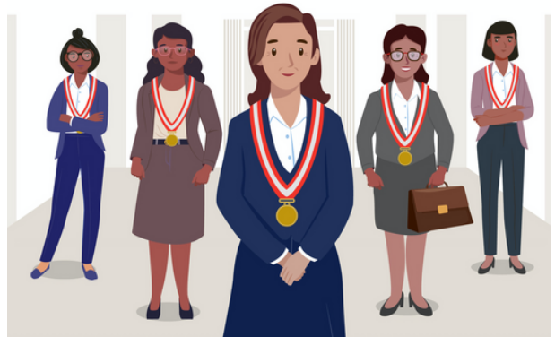
Figura tomada de la Cartilla #Justiciaconigualdad "Promoviendo la Paridad"

(*) Los seminarios se realizaron en coordinación con la Comisión de Acceso a la Justicia para personas en condición de Vulnerabilidad y Justicia en tu comunidad, y el Congreso Jurídico se realizó conjuntamente con la Organización Internacional del Trabajo, la Pontificia Universidad Católica del Perú, la Universidad de Granada y la Red Iberoamericana de investigación sobre formas contemporáneas de esclavitud y derechos humanos