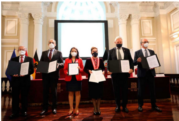
Suscripción de la Declaración de Compromiso

En el mes de octubre de 2021, se suscribió el Convenio de Ejecución del proyecto “Fortalecimiento del Sistema de Justicia Especializado contra la Violencia hacia la Mujer” entre la cooperación alemana al desarrollo GYZ y el Poder Judicial para la implementación denominado “Proyecto ForSNEJ”; iniciativa que se desarrolla en el marco del Proyecto “Fortaleciendo la prevención y la justicia frente a la violencia de género contra las mujeres” suscrito entre la Unión Europea y el Estado peruano.