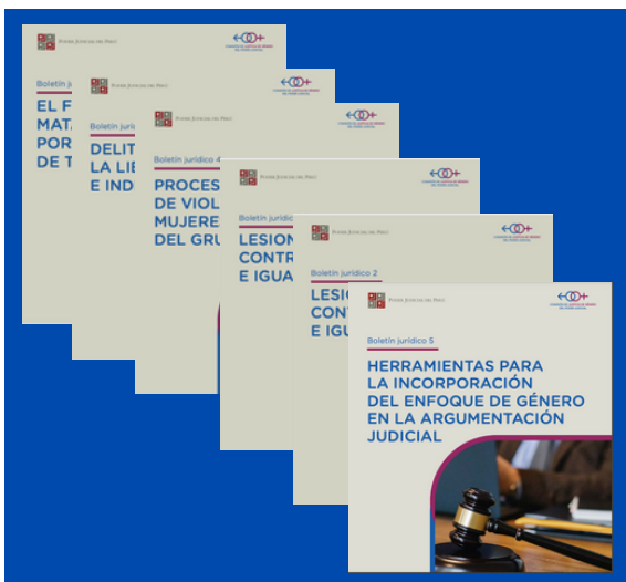
Carátulas de los boletines.

Los Boletines Jurídicos especializados analizan la normatividad y la jurisprudencia reciente sobre ejes relevantes de justicia de género, con el objetivo de dotar a magistrados y magistradas, de insumos para la argumentación en la resolución de casos: