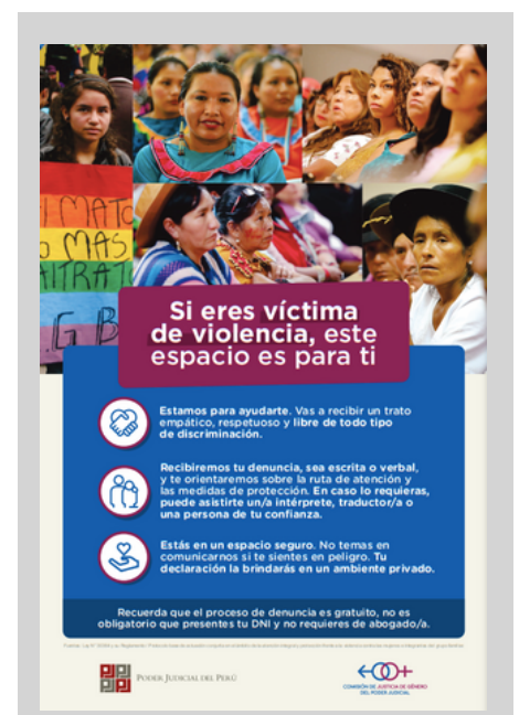
Afiche para usuarias del Poder Judicial

Adicionalmente, entre junio y setiembre, se elaboraron 9 boletines jurídicos "Género y Justicia", con avances normativos y jurisprudenciales, los que se difundieron en redes y a las Comisiones Distritales de Justicia de Género de las Cortes Superiores del país. Finalmente, se elaboraron 3 audiovisuales cortos con orientaciones para juzgar con enfoque de género, el SNEJ y el uso de lenguaje inclusivo; los que serán utilizados en las capacitaciones a realizarse en el año 2022.