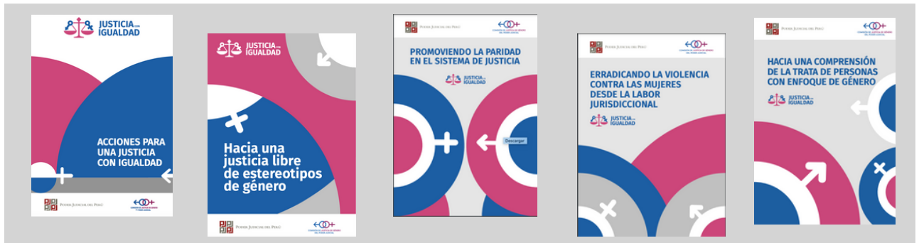
Carátulas de las Cartillas de la Campaña #JusticiaconIgualdad

Entre octubre y diciembre, con el objetivo de reforzar los conocimientos y la obligatoriedad de incorporar el enfoque de género en la actuación de las y los integrantes del Poder Judicial, se limplementó la campaña #JusticiaconIgualdad para redes, con 5 hitos temáticos : i) acciones para una justicia con iguadad; ii) estereotipos de género; iii) violencia de género; iv) paridad; y v) trata de personas.